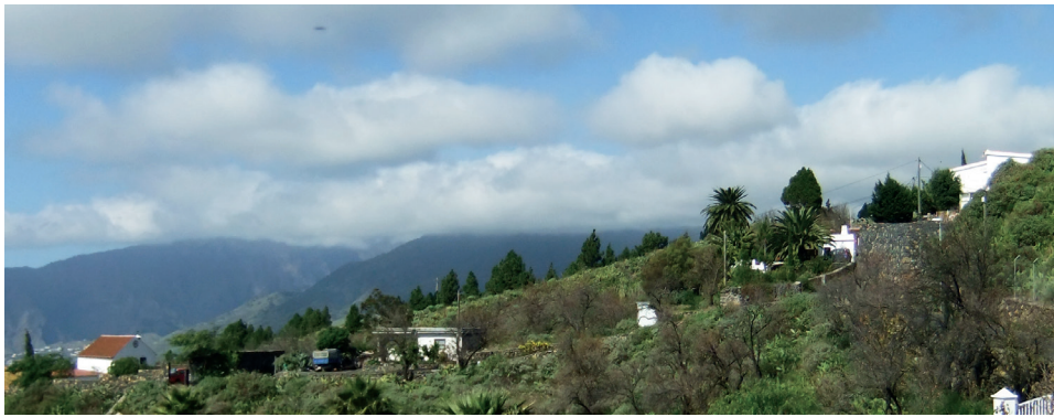
Das Haus, versteckt in den Palmen • la casa, escondido entre las palmeras