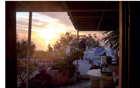
2021. Arbeitsecke im Abendlicht • Rincón de trabajo a la luz de la tarde