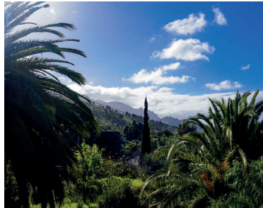
2018. Blick vom Haus nach Süden • vista al sur