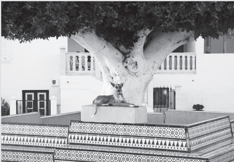
„Der gelbe Hund“ in Puerto Naos • „El perro amarillo“.

Wenn es einmal zu einer Nachauflage kommen sollte, würde ich die Adressen und Namen des Verschwundenen zu den Fotos und Texten hinzuschreiben. Zum Beispiel stünde dann unter meinem Vorwort „Calle El Frontón 7“, unter dem Text „Der Hundeboulevard“ „Calle Alcalá“ und unter den Gedichten von Lucía Rosa González: „El Pampillo“ (Todoque).