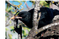
Junger Graja • joven graja