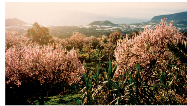
Blick durch den Garten ins Tal und Haus in den 80er-Jahren • vista a través del jardín hacia el valle y la casa en los años 80