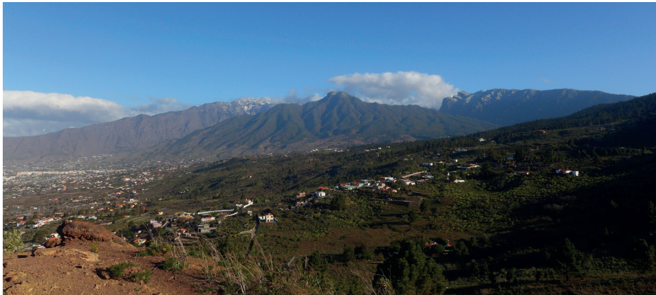
Blick auf unsere Gegend (Alcalá, El Frontón) beim Spaziergang auf der Montaña Rajada • vista de nuestra zona durante un paseo por la Montaña Rajada