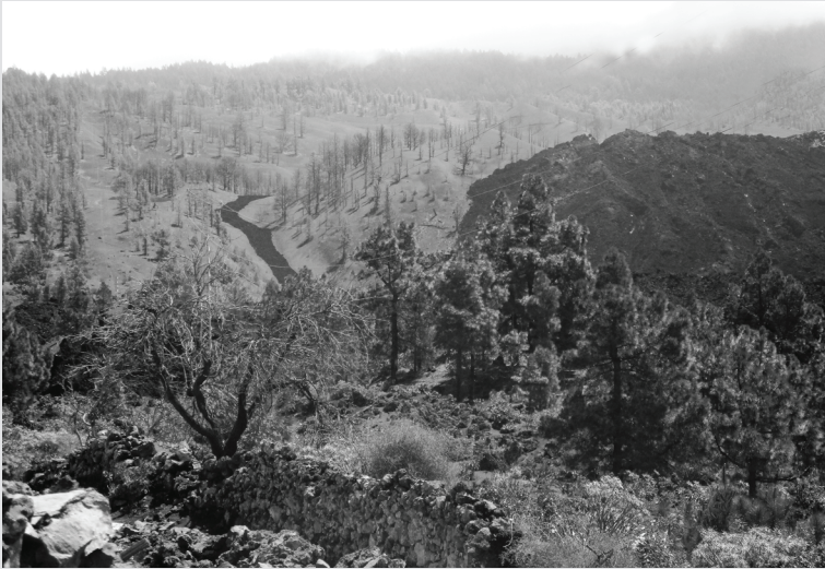
04.04.2022. Der kleine schnelle Strom kam am 01.10.2021 direkt zur Häusergruppe, floss später in den großen • La pequeña y rápida colada llegó directamente al grupo de casas el 01.10.2021, para luego desembocar en la gran colada.

imagen espectacular delante de la casa, ésta aparecía a menudo en vídeos y en la compilación al final de la erupción. Tan arriba, cerca de la primera boca, fluía rápidamente, transportando rocas enormes. Directamente junto a la casa había un pequeño monte en el cual se encontraba un pino que había crecido después del incendio del 2016 y que tenía una copa casi redonda. (A lo largo de los años hubo varios incendios que casi nos alcanzan; los vecinos más jóvenes, una vez incluido yo, mojaron las casas día y noche con mangueras de jardín. En la Cabeza de Vaca floreció con especial intensidad en la primavera posterior). En este cerro se encontraban camarógrafos con máscaras antigás. Al final solo se veía la antigua palmera grande, al menos su contorno, como si fuera un fantasma. Era impresionante que resistiera tanto.