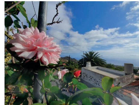
Blick vom Nachbarshaus über unser Dach aufs Meer • Vista desde la casa vecina sobre nuestro techo hacia el mar.