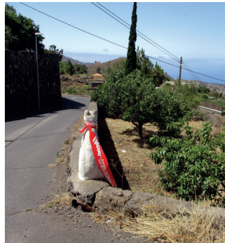
10.07.2021, nach einem Autorennen. Unsere Steinkatze saß ca. 30 Jahre am Hauseingang • después de una carrera de coches. Nuestro gato de piedra se sentó durante unos 30 años en la entrada de la casa.