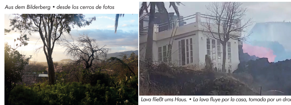
Lava fließt ums Haus. • La lava fluye por la casa, tomada por un dron.