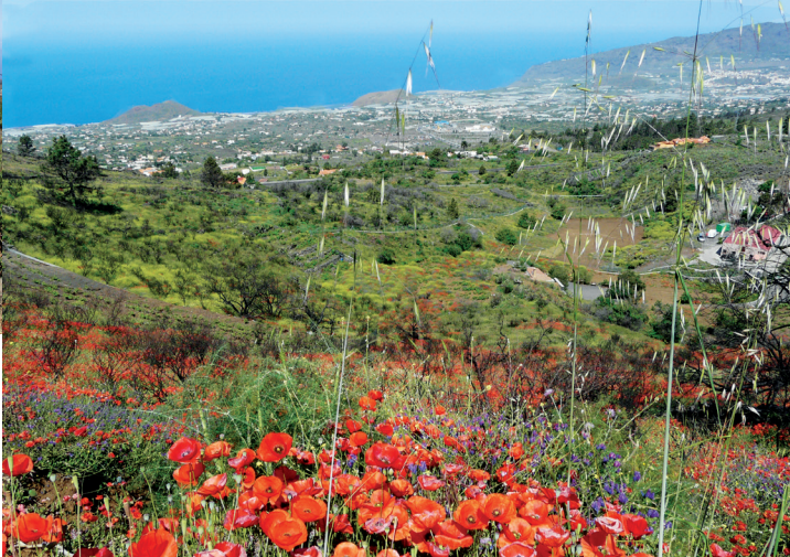
Blick ins Tal beim Spaziergang auf der Cabeza de Vaca • vista del valle desde Cabeza de Vaca